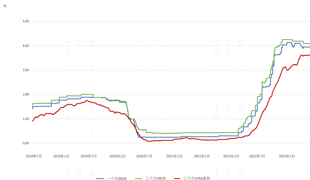
图二：一个月SIBOR、三个月SIBOR和三个月SORA复利与以往走势的比较